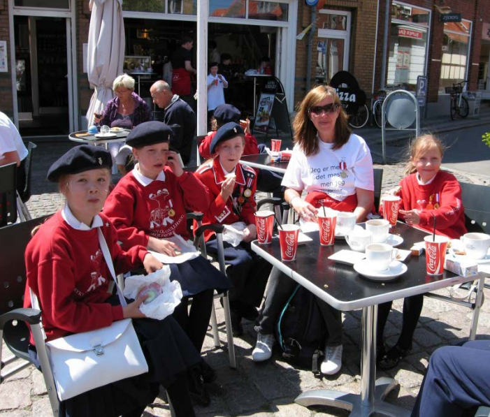
Vel fortjent pause etter spilling!